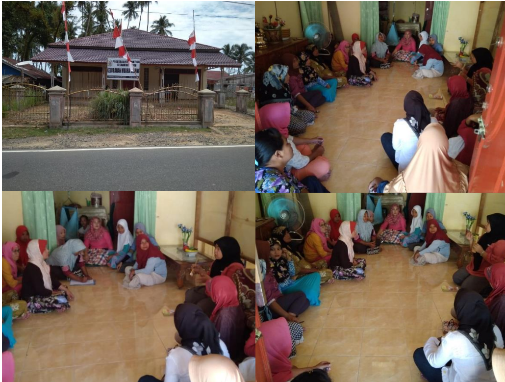
Gambar 1. Kegiatan Sosialisasi di Kelurahan Hajoran, Kabupaten Tapanuli Tengah